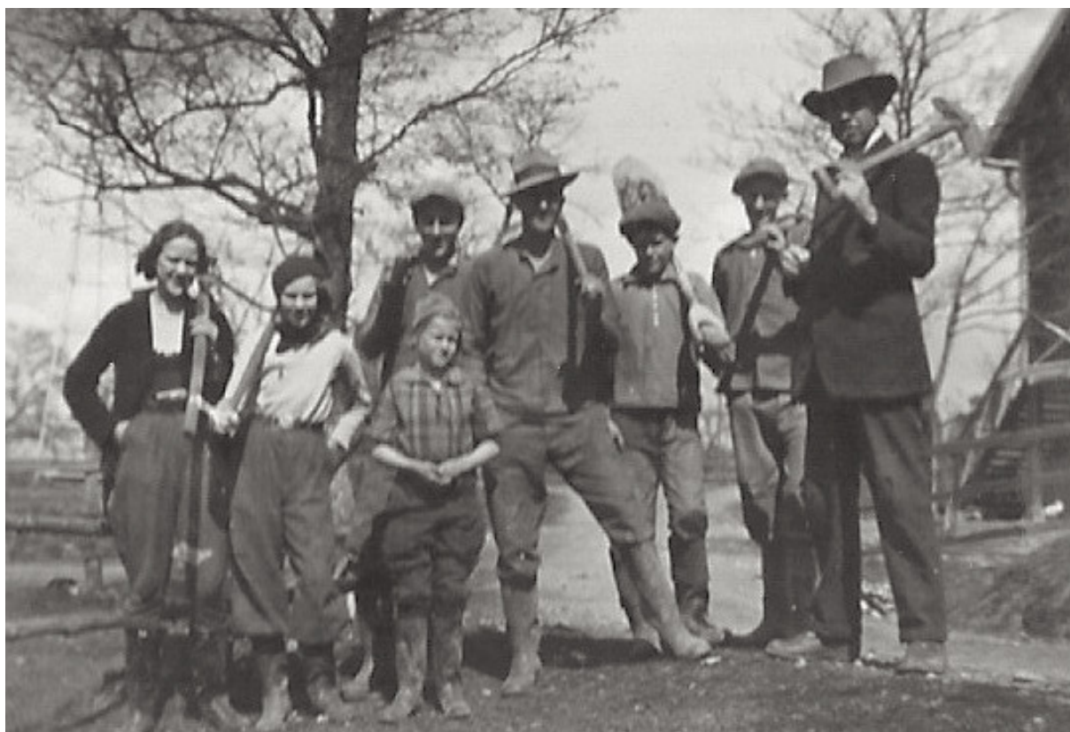
På väg till skogen.