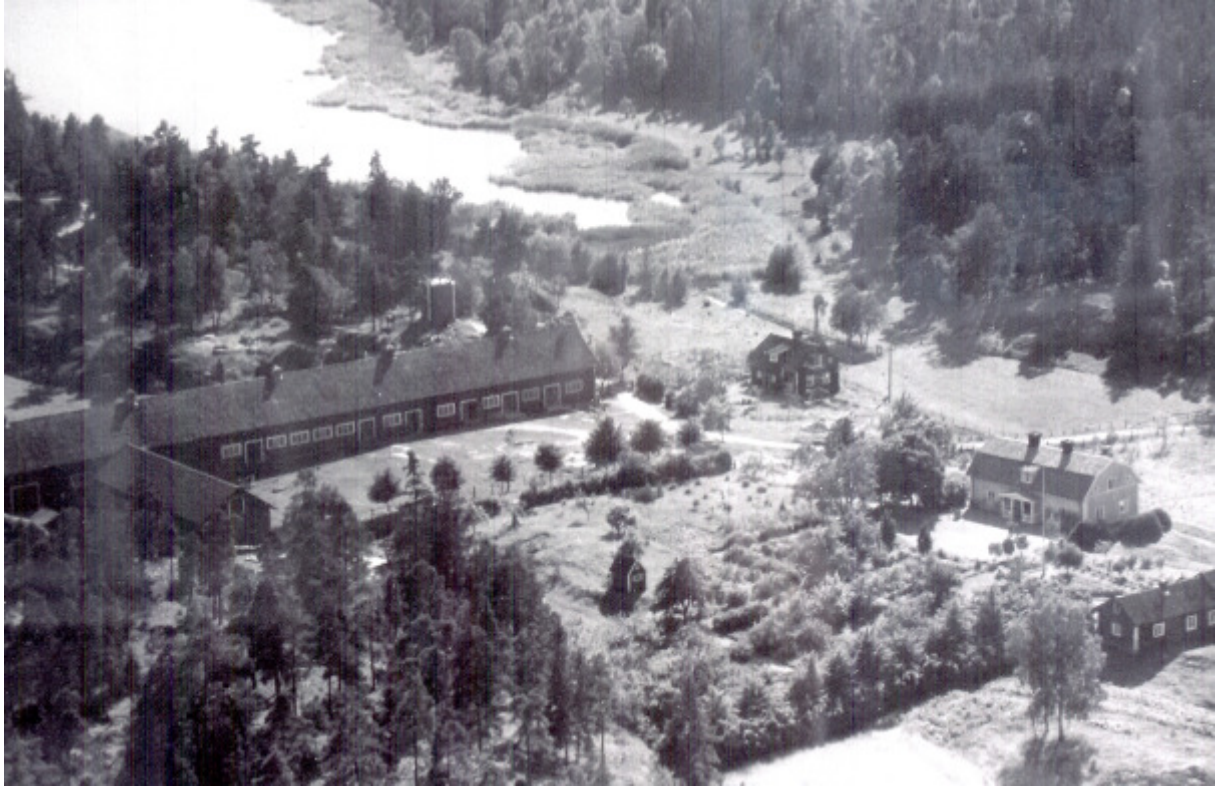
Flygbild från ca 1937