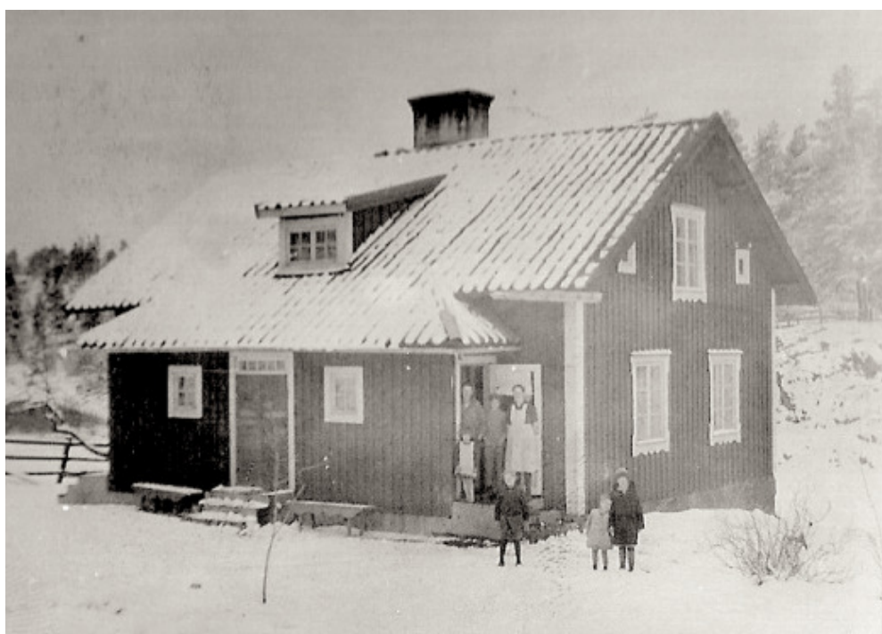
Arrendatorbostaden en vinterdag