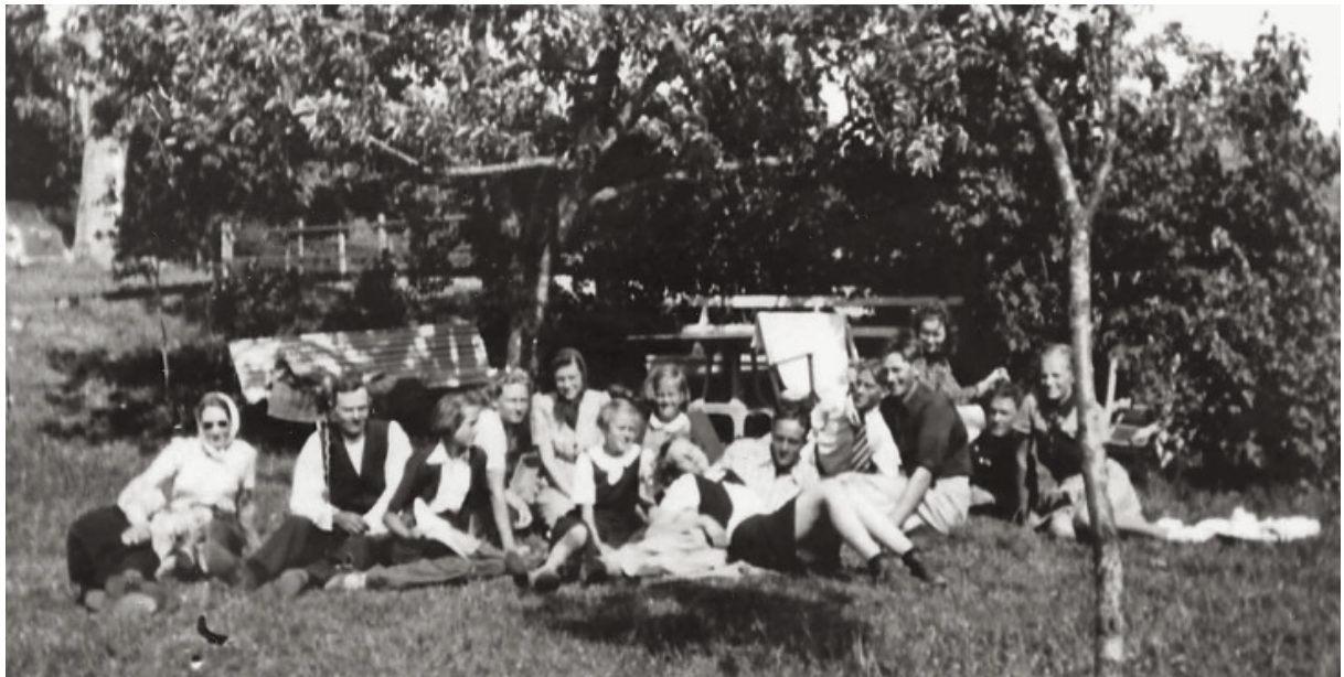
Midsommar på gräsmattan